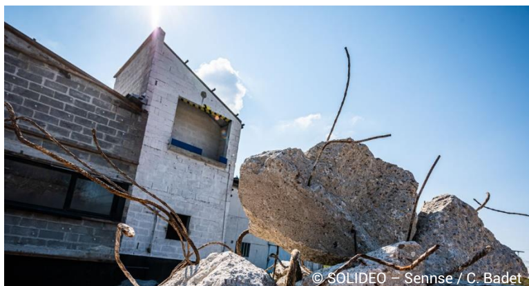
Le chantier de déconstruction du CEREMA mi-avril

Les travaux ont lieu du lundi au vendredi de 7h à 19h .